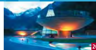
AQUA DOME – TIROL THERME LÄNGENFELD

Billet journalier: adultes € 9,90 enfants (6-15 ans) € 5,00