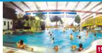
FREIZEIT ARENA ERLEBNISHALLENBAD SÖLDEN

Billet journalier: adultes € 5,00 enfants € 2,00