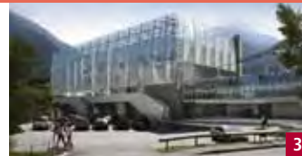
GONDELBAHN GAISLACHKOGEL NOUVEAU TÉLÉCABINE / SÖLDEN

Tarif sans l'Ötztal Card (Tarif normal)/Remontée et descente Adultes € 13,00 / enfants € 6,50