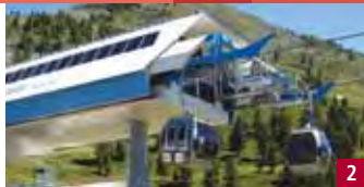
ACHERKOGELBAHN TÉLÉCABINE / OETZ

Tarif sans l'Ötztal Card (Tarif normal)/Remontée et descente Adultes € 12,00 / enfants € 6,00