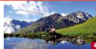
GIGGIJOCHBAHN TÉLÉCABINE / SÖLDEN

Tarif sans l'Ötztal Card (Tarif normal)/Remontée et descente Adultes € 24,00 / enfants € 14,00