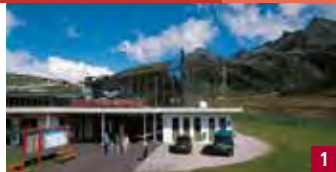
DREI SEEN BAHN TÉLÉSIÈGE / KÜHTAI